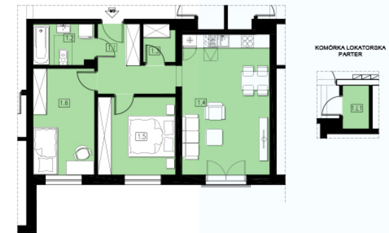
KOMÓRKA LOKATORSKA PARTER

Grupa Budowlana COMPLEX Sp. z o.o. Sp. k.