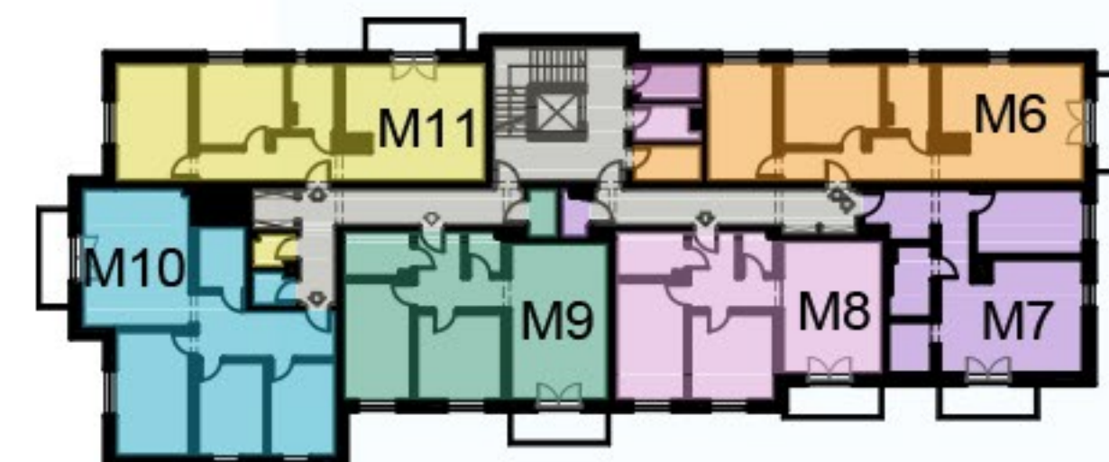
KOMÓRKA LOKATORSKA PIĘTRO 1