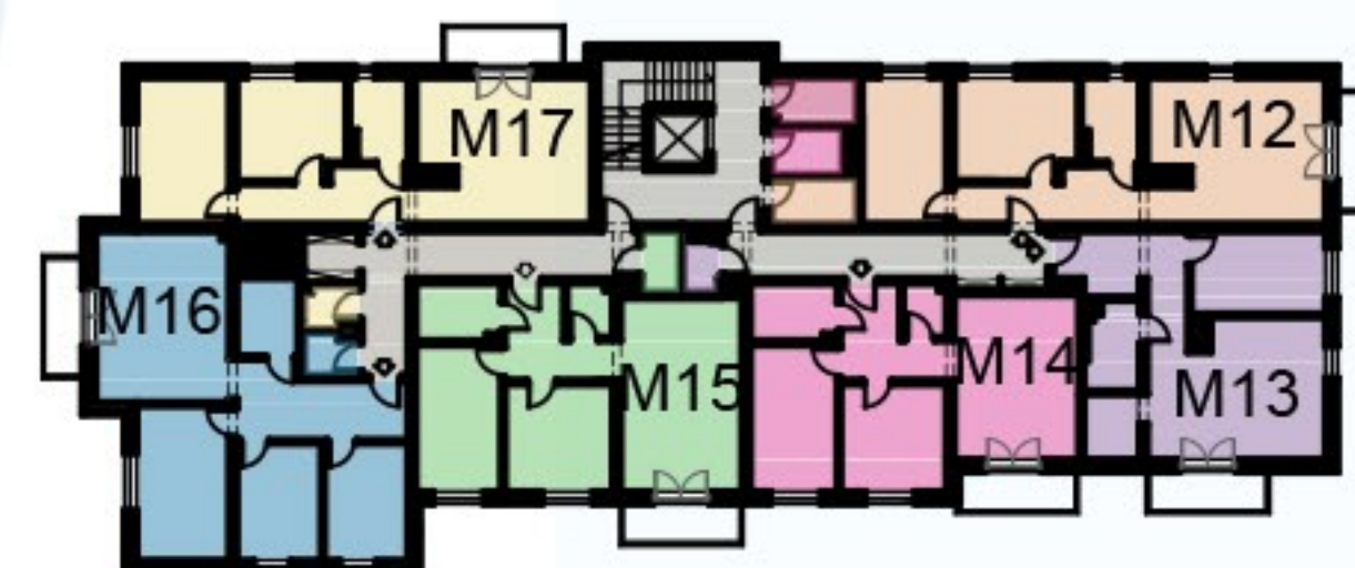
KOMÓRKA LOKATORSKA PIĘTRO 2