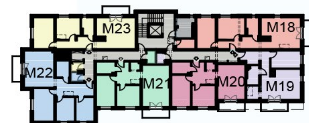
KOMÓRKA LOKATORSKA PIĘTRO 3