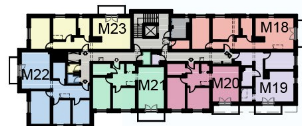
KOMÓRKA LOKATORSKA PIĘTRO 3